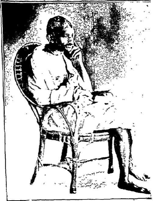
शांतता घ अनत्याचारी चळवळीचे प्रवर्तक.